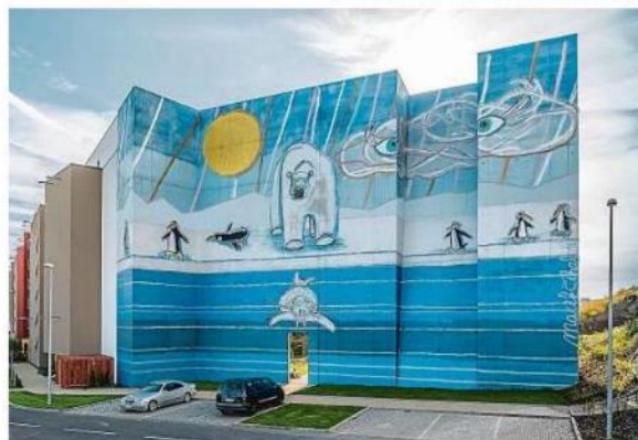
Umění do ulic Obraz malíře Marka Čhala, který se věnuje monumentálním realizacím v architektuře, zdobí protihlukovou stěnu v Praze na Proseku. Foto: Finep