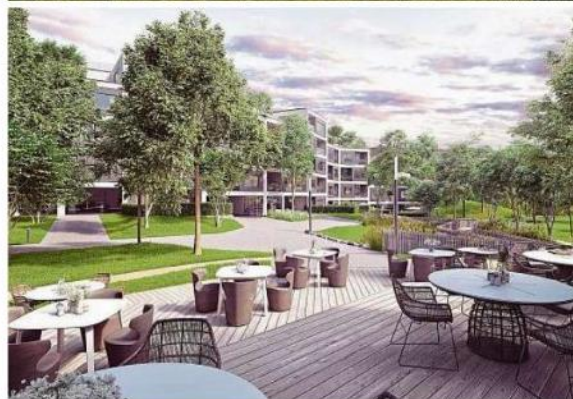
Setkávání V posledních letech se klade důraz na komunitní prostory pro společná setkávání. Nejčastěji mají podobu klubovny či venkovního posezení.