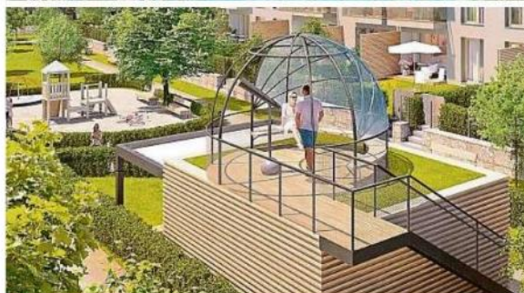
Romantika Na hvězdárně Na střeše zahradního domku, který slouží pro společná setkávání, je kopule s dalekohledem pro pozorování hvězd. Vizualizace: JRD