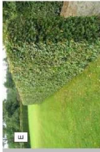
Svařované panely se čtyřhrannými oky - ref. Pilofor super Zn+PVC zelený. celková výška 1800mm + výsadba živého plotu (habr).