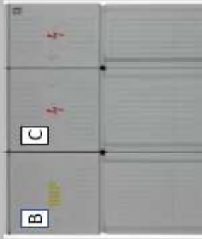
Sdružený plastový pilíř pro hlavní uzávěr plynu, elektroměrové a přípojkové skříně elektro