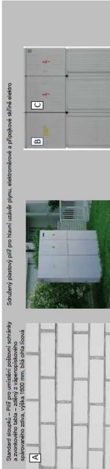
A Standard sloupků – Pilíř pro umístění poštovní schránky a zvukového tabla – zelený z vápenopískového spárovaného zdiva, výška 1600 mm, bílá cihla lícová