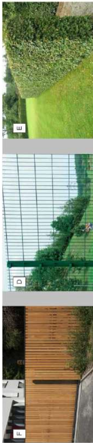
F Standard plotu: