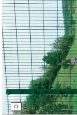
Svařované panely se čtyřhrannými oky - ref. Pliofor super Zn+PVC zelený, celková výška 1600mm + výsadba živého plotu (habr).