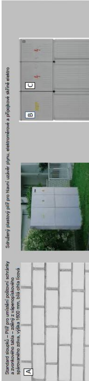
A Standard sloupků – Pilíř pro umístění poštovní schránky a zvonkové tabule – zděný z vápenopískového spárovaného zdiva, výška 1600 mm, bílá cihla lícová