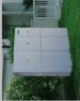
B Schrucený plastový pilíř pro hlavní uzávěr plynu, elektroměrové a přípojkové skříně elektro