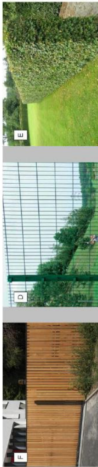
F Standard plotu: