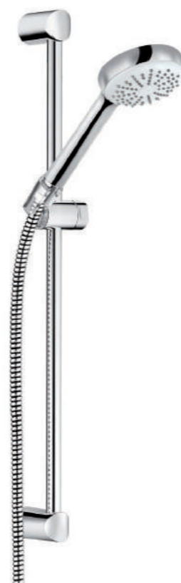
▲ KLUDI Logo 1S Sprchový set