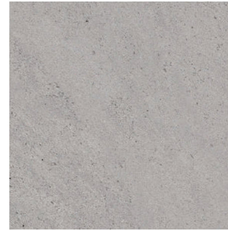
▲ MARAZZI Stonework Grey 30 x 60 cm, 60 x 60 cm