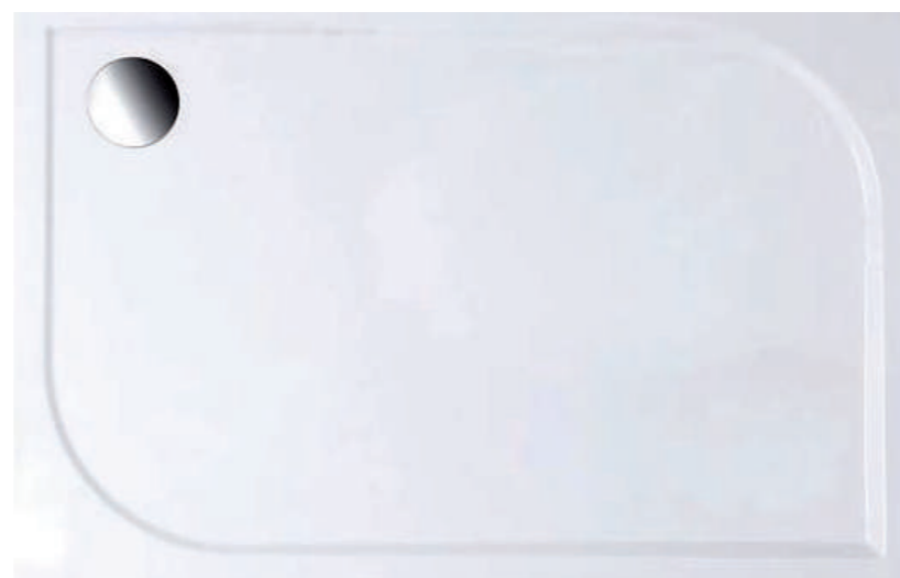
▲ Gelco SARA Sprchová vanička, 120 x 90 cm, litý mramor