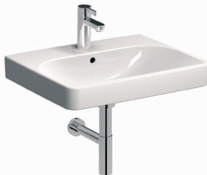
▲ KOLO TRAFFIC Keramické umyvadlo