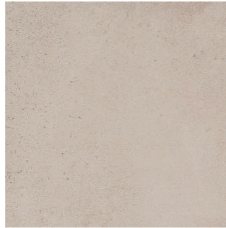
▲ MARAZZI Stonework Beige 30 x 60 cm, 60 x 60 cm