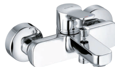
▲ KLUDI Pure&Easy Vanová páková baterie