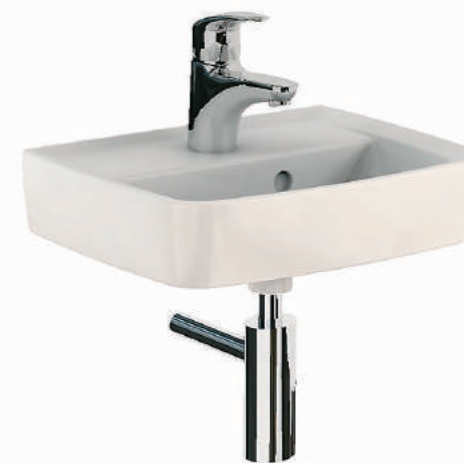
▲ KOLO Nova Pro Umývatko