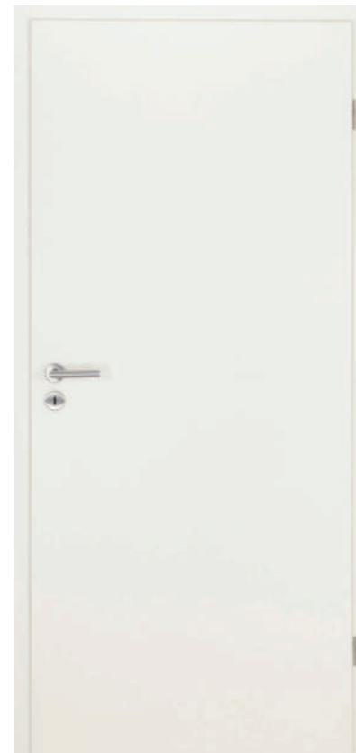
▲ Dextūra Výška 210 cm, superlak