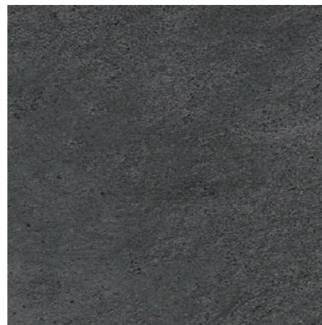
▲ MARAZZI Stonework Anthracite 30 x 60 cm, 60 x 60 cm