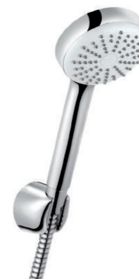
▲ KLUDI Logo 1S Vanový sprchový komplet