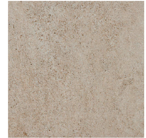
▲ MARAZZI Stonework Taupe 30 x 60 cm, 60 x 60 cm