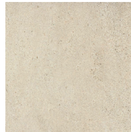
▲ MARAZZI Stonework White 30 x 60 cm, 60 x 60 cm