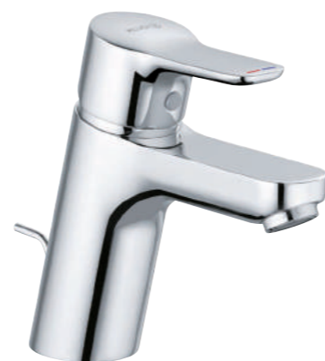
▲ KLUDI Pure&Easy Umyvadlová páková baterie