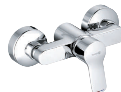
▲ KLUDI Pure&Easy Sprchová páková baterie