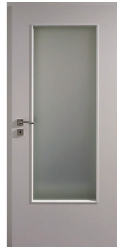
▲ Dextūra Výška 210 cm, superlak