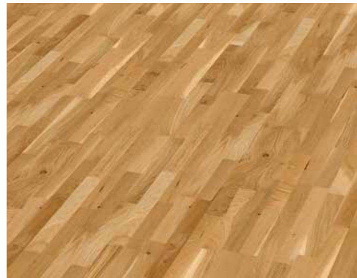
▲ STEIRER Parket Novoloc – Dub Country Dřevěná podlaha, tl. 8,5 mm, vč. obvodových lišt