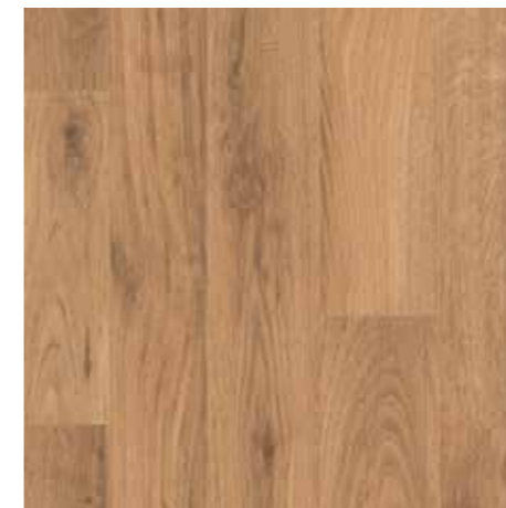
▲ EGGER Eclíc – Dub parketa rustik Laminátová plovoucí podlaha vč. obvodových lišt