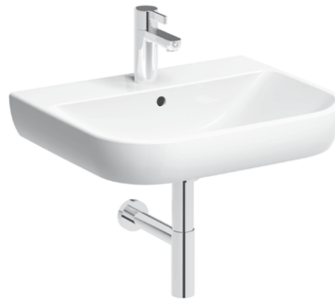
▲ KOLO TRAFFIC Keramické umyvadlo