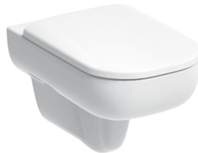
▲ KOLO Traffic WC závěsné