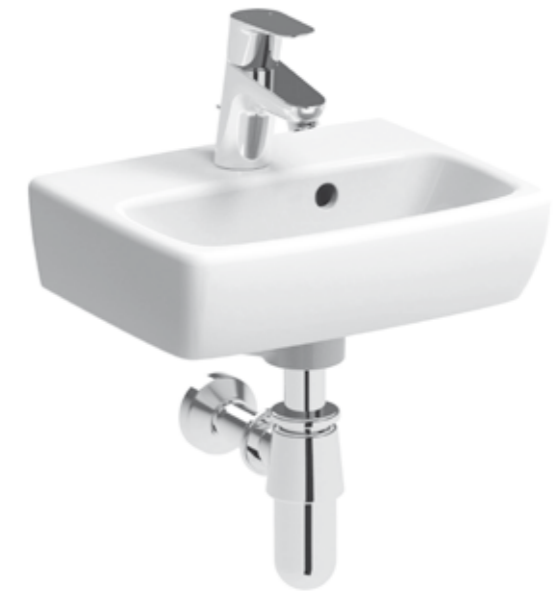
▲ KOLO TRAFFIC Nova Pro Umývatko