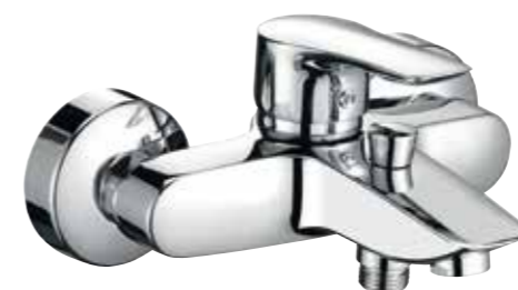
▲ KLUDI Tercio New Vanová baterie páková