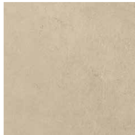
▲ MARAZZI S Daisen Beige 30 x 60 cm