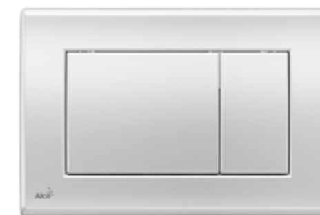
▲ ALCAPLAST Splachovací tlačítko, chrom mat