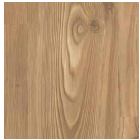
▲ EGGER Eclic – Smrk prkno kanadský Laminátová plovoucí podlaha vč. obvodových lišt