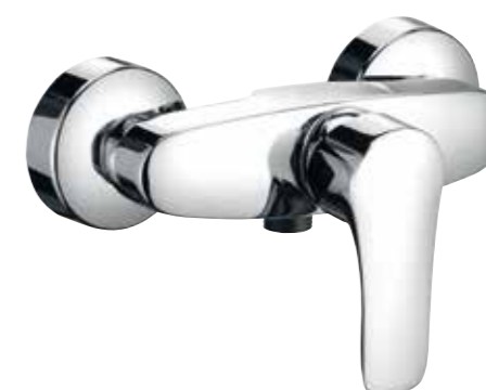
▲ KLUDI Tercio New Sprchová baterie páková