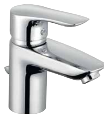
▲ KLUDI Tercio New Umyvadlová páková baterie