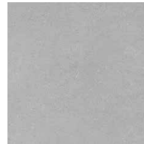
▲ MARAZZI S Daisen Grey 30 x 60 cm