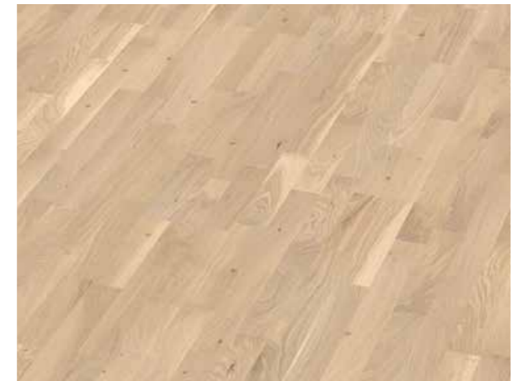
▲ STEIRER Parket Novoloc – Dub Country Bianca Dřevěná podlaha, tl. 8,5 mm, vč. obvodových lišt