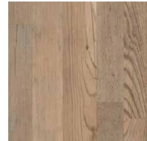
▲ EGGER Eclic – Borovice parketa šedá Laminátová plovoucí podlaha vč. obvodových lišt