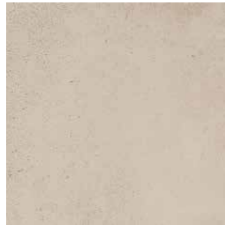
▲ MARAZZI Stonework Beige 30 x 60 cm