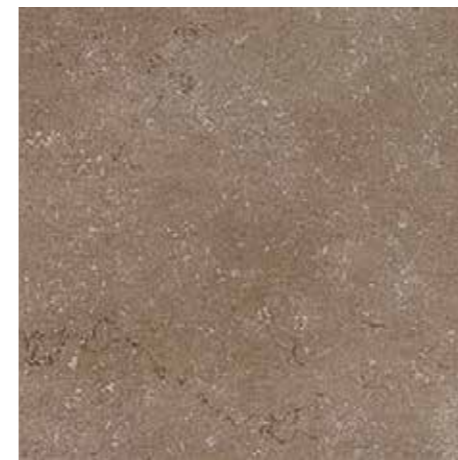
▲ MARAZZI S Daisen Brown 30 x 60 cm