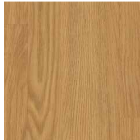
▲ EGGER Eclic – Dub prkno přírodní Laminátová plovoucí podlaha vč. bvodových lišt