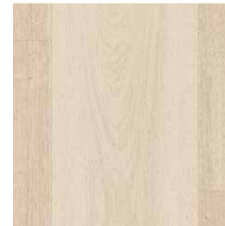
▲ EGGER Eclíc – Dub prkno bílý Laminátová plovoucí podlaha vč. obvodových lišt