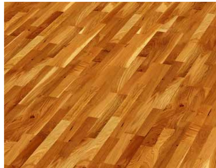
▲ STEIRER Parket Novoloc – Dub Country Sahara Dřevěná podlaha, tl. 8,5 mm, vč. obvodových lišt