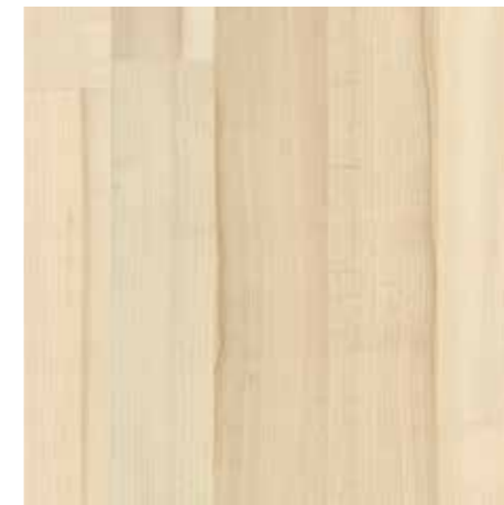
▲ EGGER Eclic – Javor parketa Laminátová plovoucí podlaha vč. obvodových lišt