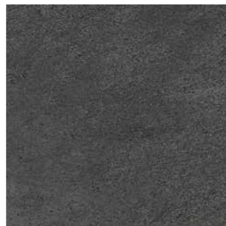
▲ MARAZZI Stonework Anthracite 30 x 60 cm