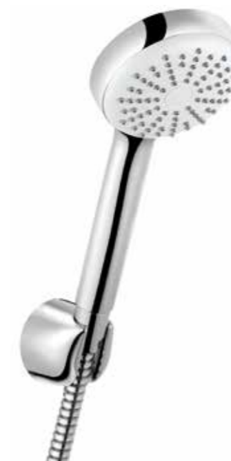
▲ KLUDI Logo 1S Vanový sprchový komplet