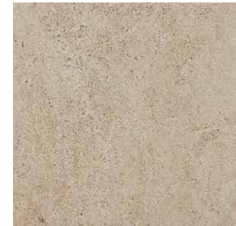
▲ MARAZZI Stonework Taupe 30 x 60 cm