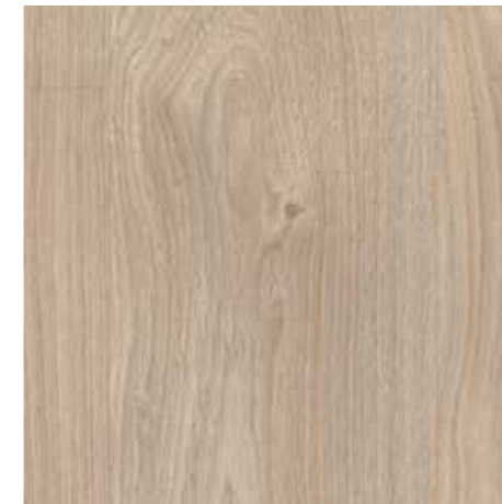
▲ EGGER Eclic – Dub prkno stříbrný Laminátová plovoucí podlaha vč. obvodových lišt