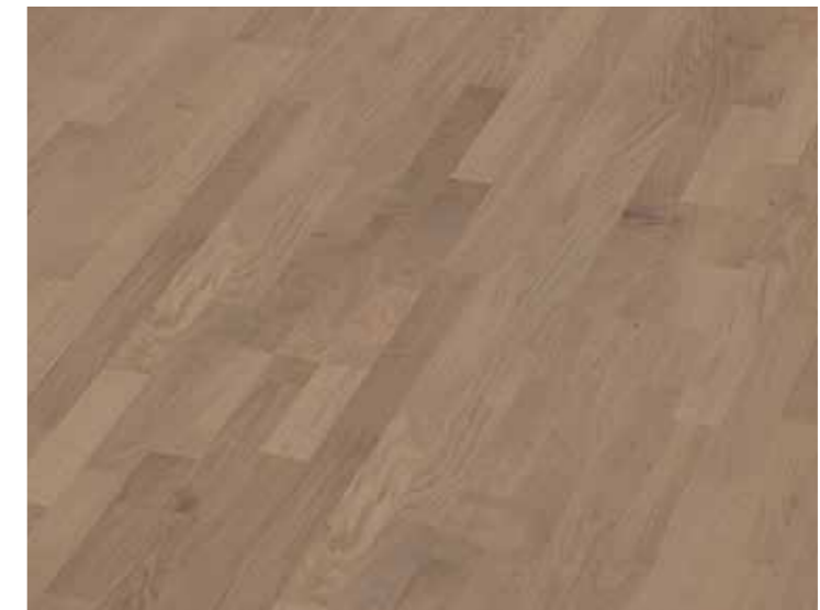
▲ STEIRER Parket Novoloc – Dub Classic Silva Dřevěná podlaha, tl. 8,5 mm, vč. obvodových lišt