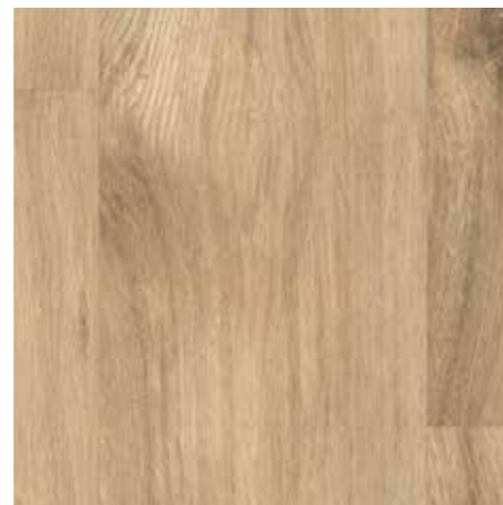
▲ EGGER Eclíc – Dub prkno bělený Laminátová plovoucí podlaha vč. obvodových lišt