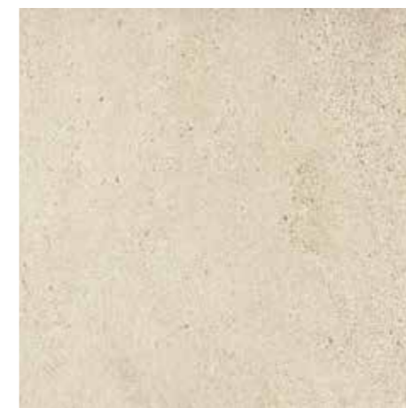
▲ MARAZZI Stonework White 30 x 60 cm