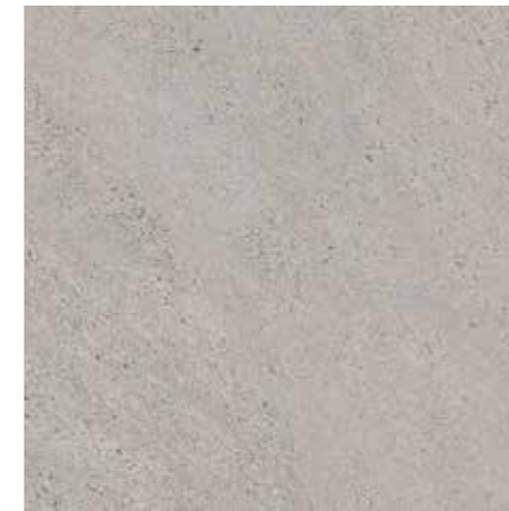
▲ MARAZZI Stonework Grey 30 x 60 cm