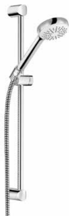
▲ KLUDI Logo 1S Sprchový set